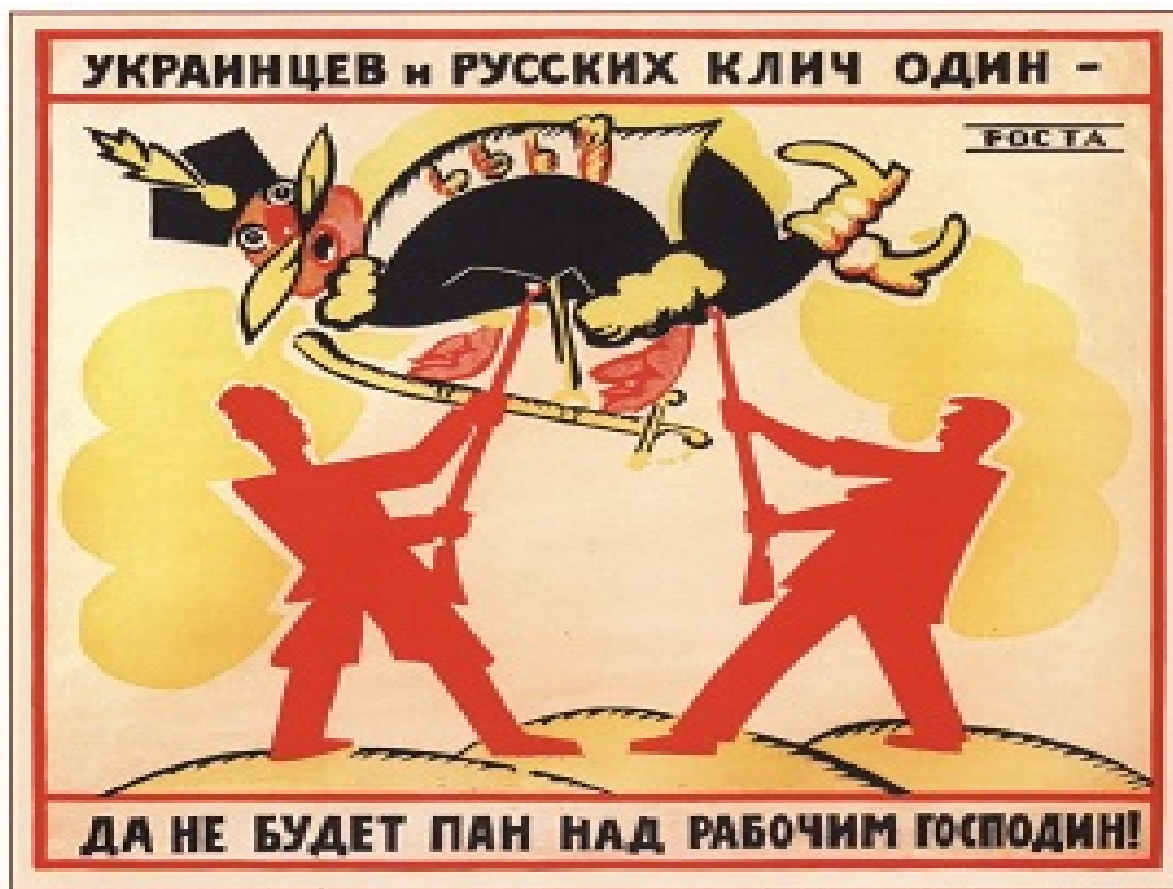
57. Маяковский В. Украинцев и русских клич один... 1920

Среди тех, кто внес свой вклад в агитационное искусство того времени - Владимир Маяковский. Он не только сочинял меткие строчки, но и сам рисовал яркие картинки.